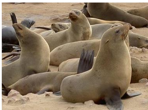
Township Tour à Swakopmund, visite guidée par