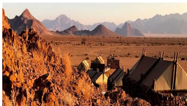
Installation dans votre chambre (disponible à partir de 14h00) Dîner logement.