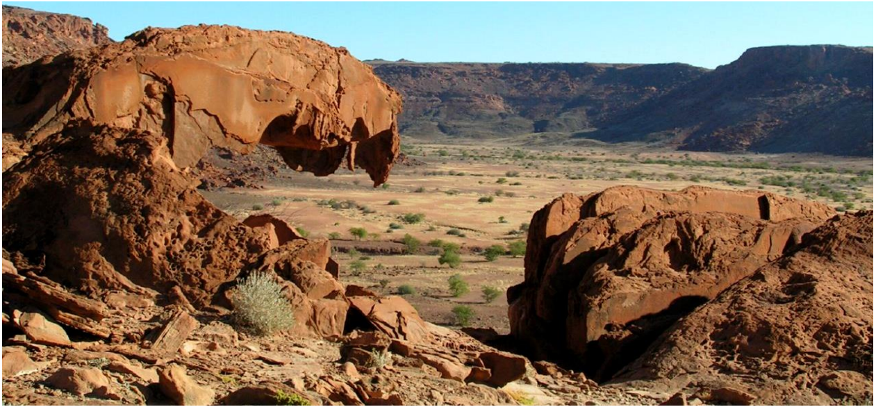
Retour au Lodge, diner logement