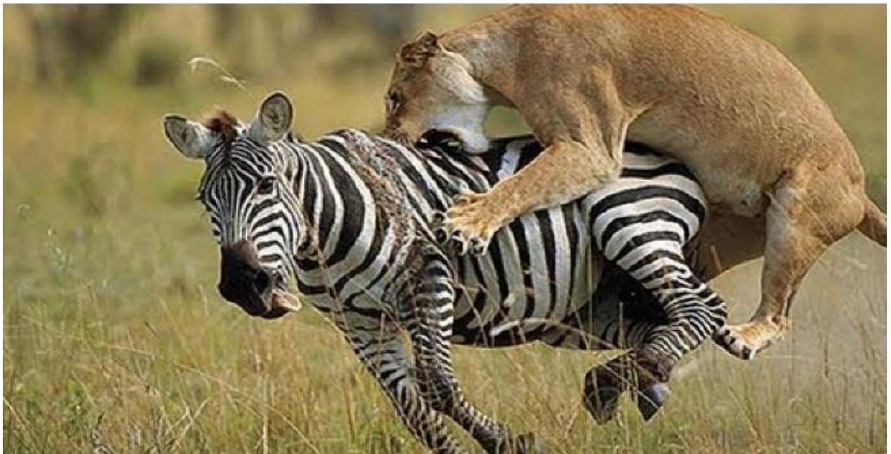
Retour au Lodge en début de soirée Dîner logement.

Réveil matinal, café / thé. Départ pour un nouveau safari , la faune se réveille, les prédateurs partent en chasse, ce sera pour vous l'occasion de faire des splendides photos. Retour au Lodge pour le petit déjeuner, Nouveau safari , vous circulerez au milieu des centaines de gnous et de zèbres, vous pourrez apercevoir un groupe d'hyènes déchaînées dépeçant une carcasse ou bien vous attendrir devant des lionceaux en train de jouer. Déjeuner Lodge et temps libre pour se reposer un peu de ses émotions Dans l'après-midi, nouveau safari en minibus . Grâce à l'ouverture totale du toit des passagers situés à l'arrière du chauffeur, vous observerez les lions, les éléphants, les guépards, les zèbres, les hyènes, les chacals, les antilopes, les gnous, les girafes, les buffles et de nombreux oiseaux.