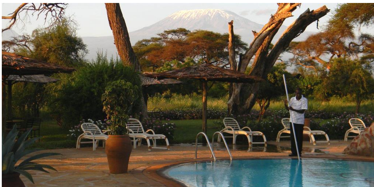
Safari en véhicule 4x4 avec toit ouvrant dans parc national d'Amboseli Retour au Lodge en fin de journée, dîner logement

Arrivée tardive pour le déjeuner au Sentrim Amboseli ou similaire www.sentrimhotels.net situé à proximité immédiate d'Amboseli, près de la porte de Kimana, au sud-est de la réserve. La vue sur le Kilimandjaro, par temps clair, est éblouissante...Les parties communes, le bar et le restaurant se tiennent sous des toits de makuti. Les 60 tentes offrent un excellent confort. Très spacieuses, elles comportent un plancher "en dur", une terrasse et une structure avec un toit sous laquelle se dresse la tente. A l'intérieur, coin salon, ventilateur, coffre-fort, grande salle de bains avec douche...Une grande piscine vous accueillera aux heures les plus chaudes de la journée