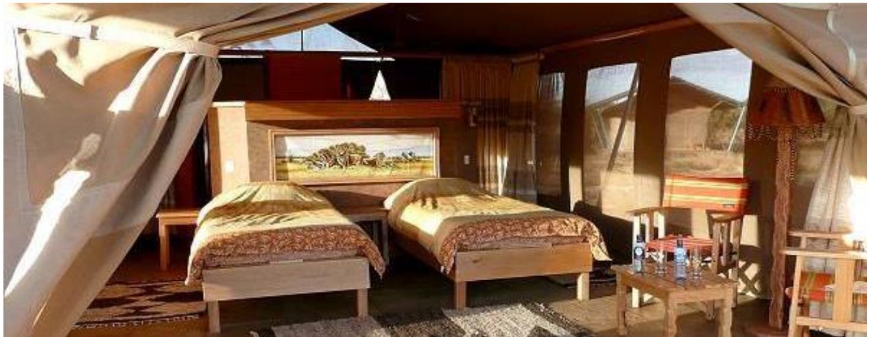
Installation dans votre tente, dîner logement.