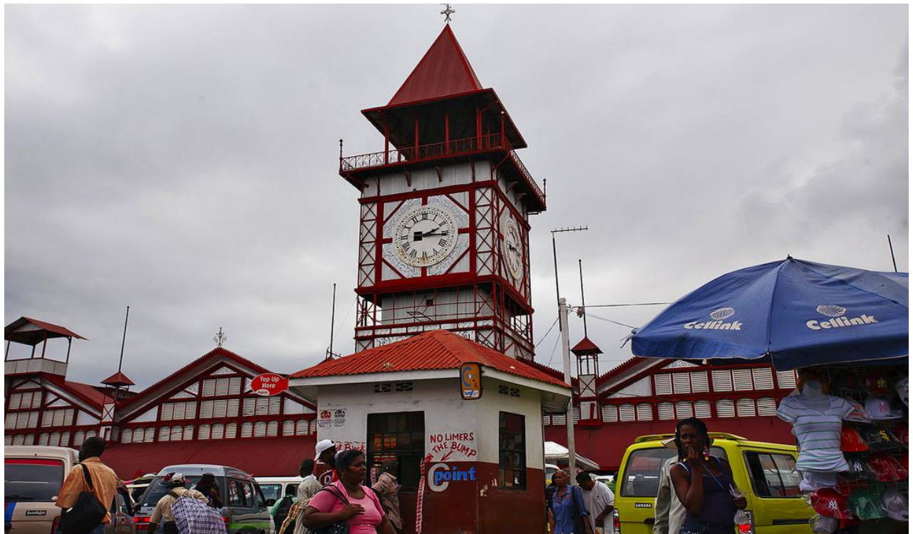
Diner, logement Jan Jan Burreh Camp ou Bird Safari Camp

Poursuite en bateau vers des îles préservant les chimpanzés. D'autres mammifères, crocodiles et hippopotames, profitent de ce havre de paix. Puis, vous emprunterez un petit bac pittoresque pour rejoindre l'île de Janjanbureh, autrefois Georgetown.