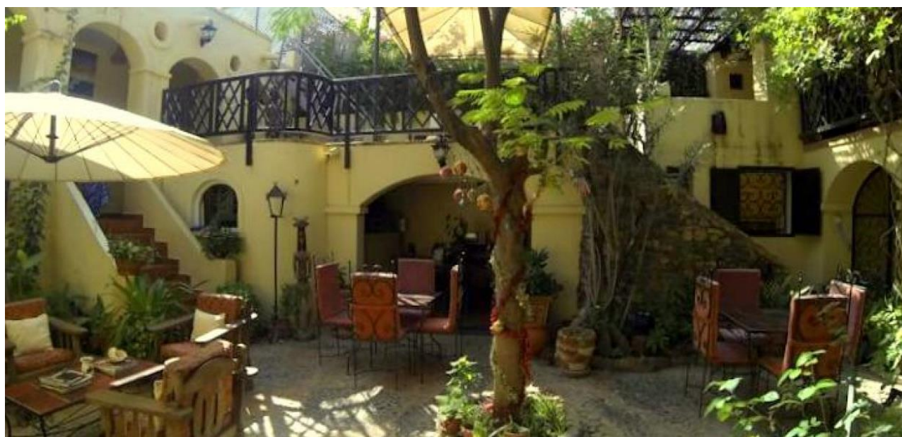
Cocktail de bienvenue à base de bissap, installation, dîner à l'extérieur et logement

Arrivée Dakar, formalités de police et de douane Accueil à l'aéroport et prise en charge par Savanna Tours & Safaris. Transfert pour l'embarcadère puis île de Gorée en chaloupe. Accueil et transfert à votre Chambre d'hôte Villa Castel