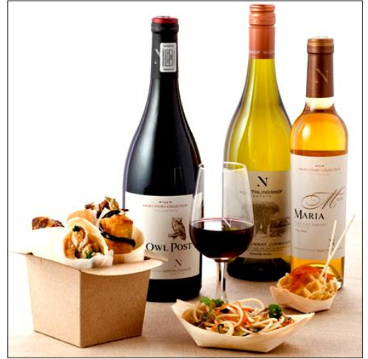
Retour Cape Town, dîner logement