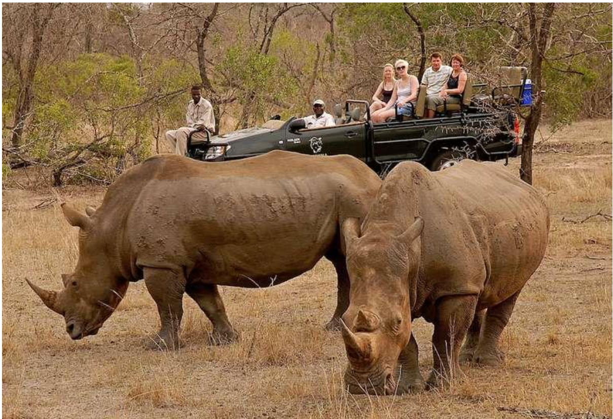
Retour au lodge dîner au lodge, logement

Petit déjeuner matinal buffet sud-africain copieux Transfert à l'aéroport de Cape Town Assistance aux formalités d'embarquement pour envol sur Hoedspruit ou Mpumalanga Airport Arrivée Kruger Park . Accueil et transfert à réserve privée du Kruger Park Cocktail de bienvenue à base de jus de fruit exotique sans alcool, Safari en 4x4 avec ranger dans la réserve privée.